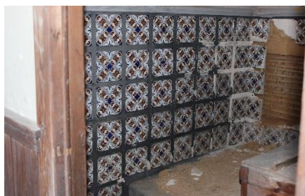
木村邸浴室のタイル