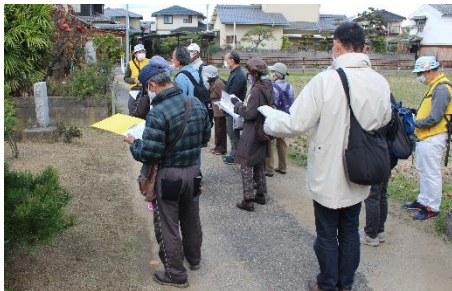
若宮様の説明を受ける参加者