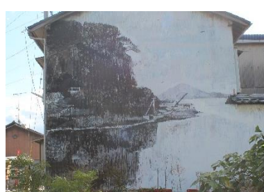
壁絵（三津浜港入口付近）