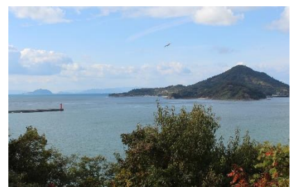
港山城跡より由利島・興居島