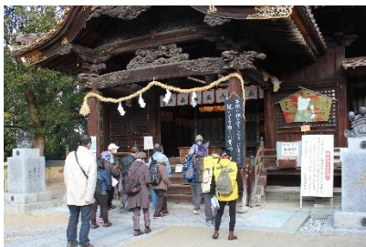
三津厳島神社に参拝