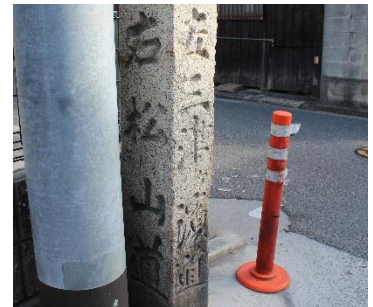
右 松山道 左 三津浜道