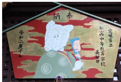
同神社の絵馬（松山西中美術部）