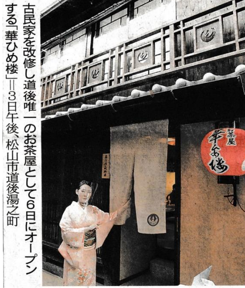
古民家を改修し道後唯一のお茶屋として6日にオープンする「華ひめ楼」—3日午後、松山市道後湯之町

道後温泉本館近くの古民家で芸者文化に触れられる「お茶屋 華ひめ楼」が松山市道後湯之町に完成し、3日に内見会があった。夜の散策時に利用してもらおうと1階にバーがあり、2階で伝統の踊りや三味線を楽しみながら食事ができる。6日午前11時にオープンする予定で「いちげんさんも大歓迎」としている。