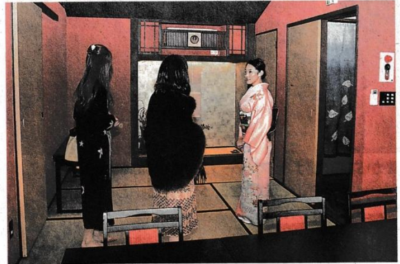
芸者の踊りや三味線を楽しめる 華ひめ楼2階の座敷—3日正午 ごろ、松山市道後湯之町