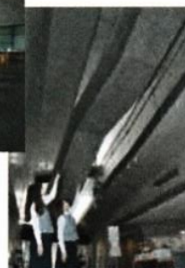
建物に入り受付前で見上げると迷路のような階段が...