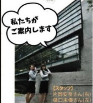
駐車場入り口。建物全体と坂の上の雲ミュージアムのプレートが写ります

世界知名建築師－安藤忠雄先生所設計の坂上之雲博物館，是非常受到旅客喜愛的IG熱門打卡景點。因地點位於松山市中心，不僅是參觀展覽，可以稍作休息或是當相約集合點的景緻咖啡廳也是廣受好評。