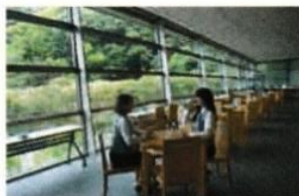
カフェの広いガラス壁からは国指定重要文化財の洋館「萬翠荘」が眺められます