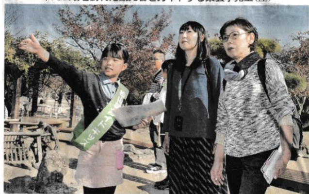
本丸広場を訪れた観光客をガイドする東雲小児童(左)

松山市の観光名所、松山城の良さを知ってより楽しんでもらおうと8日、東雲小学校（文京町）の4年生約70人が城や石垣に隠された工夫などを観光客にガイドした。